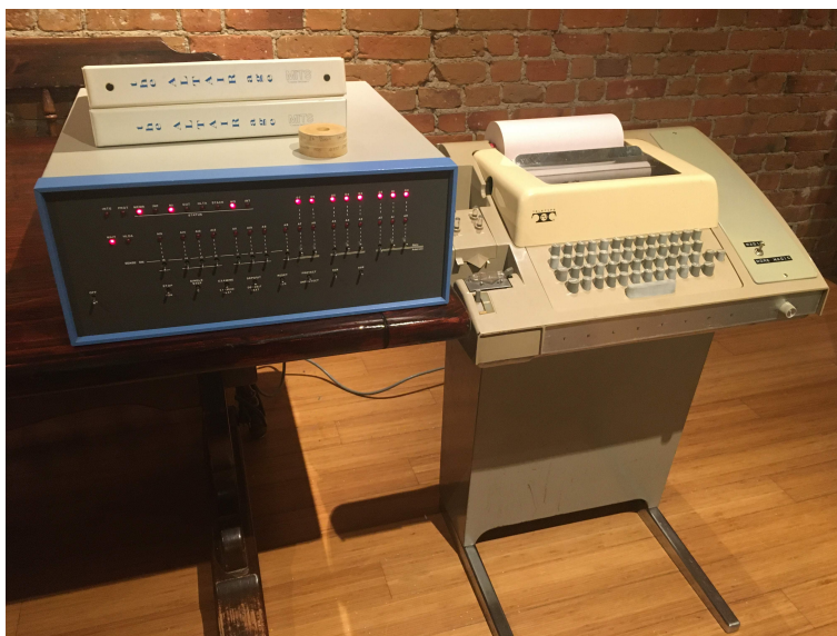
Komputer Altair 8800, fotografia autorstwa Timothy'ego Colegrove'a, źródło: https://en.wikipedia.org/wiki/Altair_8800#/media/File: Altair_8800_and_Model_33_ASR_Teletype_.jpg .

Wprawne oko zauważy przełącznik pomiędzy dwoma stanami, „magic” oraz „more magic”. Jest to referencja do historii przełącznika z takimi podpisami w laboratorium sztucznej inteligencji na uczelni MIT — http://www.catb.org/jargon/html/magic-story.html .